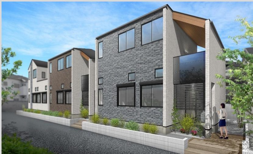
外観完成予想イメージ

“Akatsuki Terrace” は、シノケンの創業 30 周年を記念したプレミアムモデルのアパートメントシリーズです。エントランスおよび各住戸玄関への顔認証システムの採用、スマート防犯カメラの設置をはじめとした防犯設備の充実に加え、住戸の床・壁・天井の遮音性向上を実現した「シノケンコンフォートスタイル」で、従来のイメージを覆す次世代アパートメント UX（顧客体験）を提供いたします。今回決定致しました第一弾の販売物件は下記の通りです。